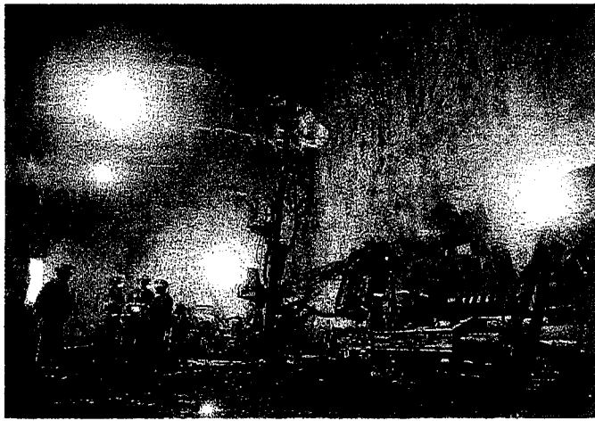
Compañía realizó un compromiso para devolver derechos de aguas.