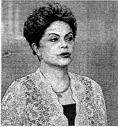
La presidenta de Brasil, Dilma Rousseff.