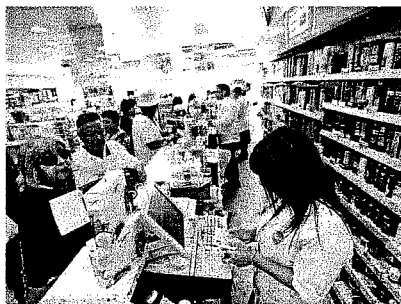
Este año las farmacias populares superarían las 50.

El dictamen, remitido también a Cenabast, el ISP, la FNE, Fonasa, Minsal, la Subdere y organismos municipales; plantea que la ley sobre Estatuto de Atención Pri-